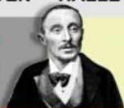
1899 Camille Jenatzy