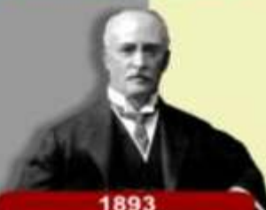
1893 Rudolf Diesel