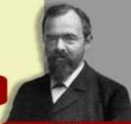
1871 Carl v. Linde