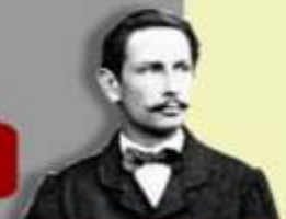
1886 Carl Benz