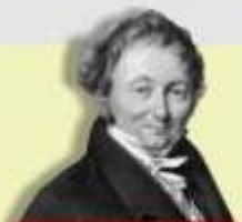
1817 Karl Drais