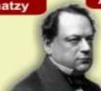
1834 Moritz v. Jacobi